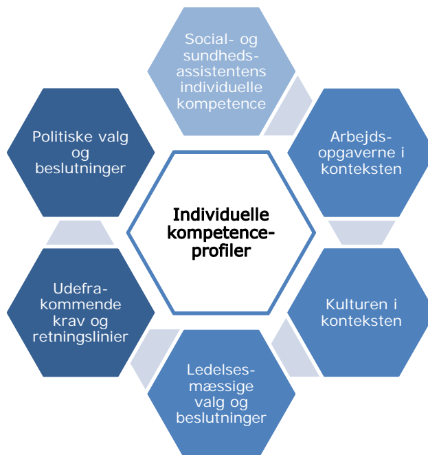
Figur 1: Styrende faktorer for social- og sundhedsassistenternes kompetenceprofil.

Undervejs i interviewene har de interviewede anskueliggjort, hvad de ser som de væsentligste styrende faktorer for kompetenceprofilerne. De interviewede ser generelt flere konkurrerende perspektiver, der med forskellig styrke i de forskellige afdelinger og på forskellige tidspunkter influerer på, hvilke jobfunktioner og kompetenceprofiler social- og sundhedsassistenter har. Faktorerne er samlet i nedenstående figur.